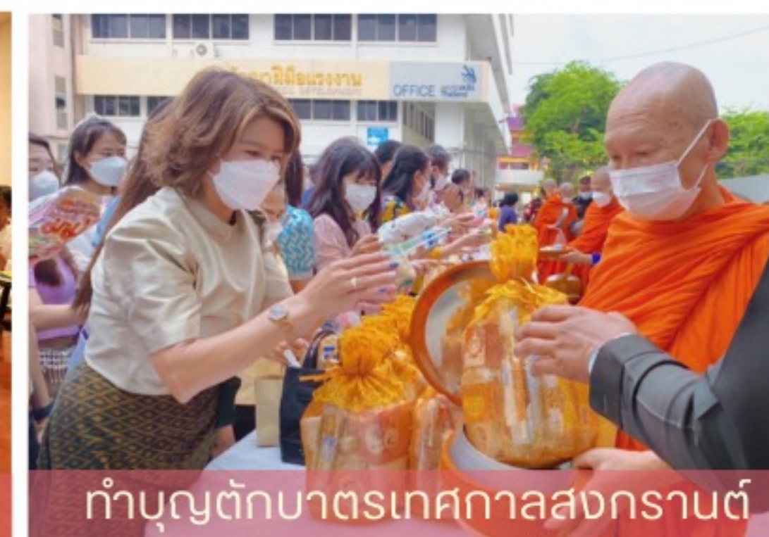
ทำบุญตักบาตรเทศกาลสงกรานต์