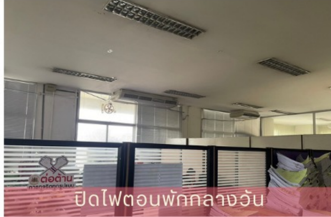
ปิดไฟตอนพักกลางวัน