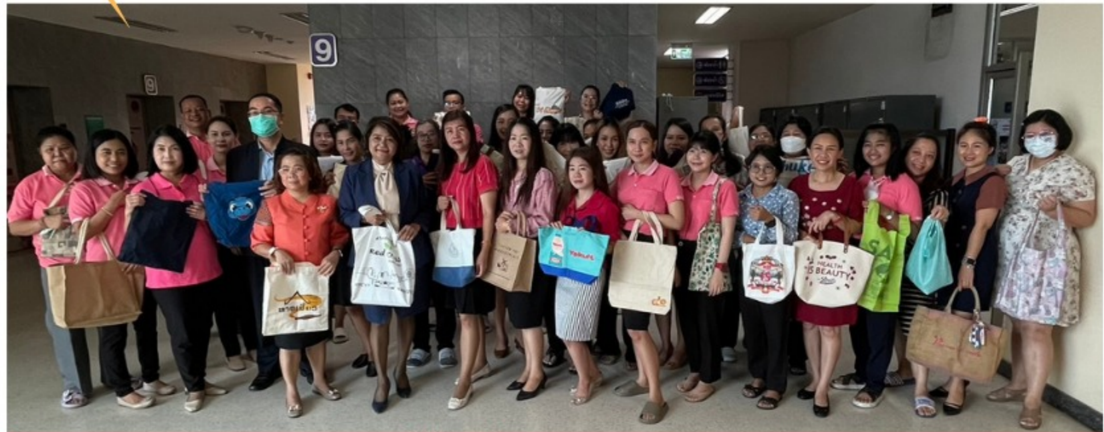
การใช้ถุงผ้าแทนถุงพลาสติก