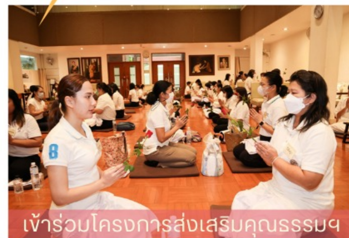
เข้าร่วมโครงการส่งเสริมคุณธรรมฯ