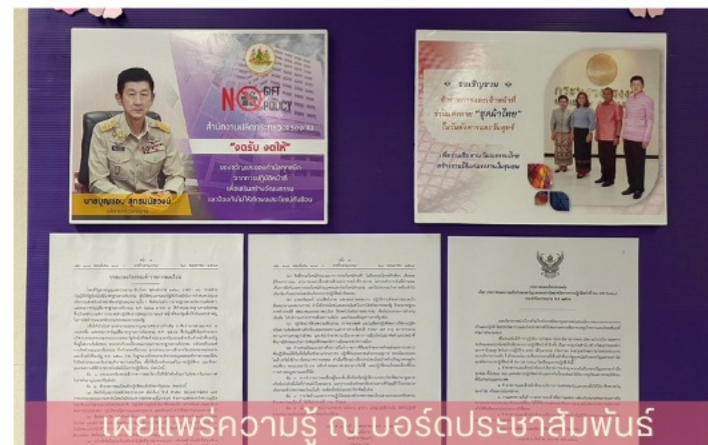
เผยแพร่ความรู้ ณ บอร์ดประชาสัมพันธ์