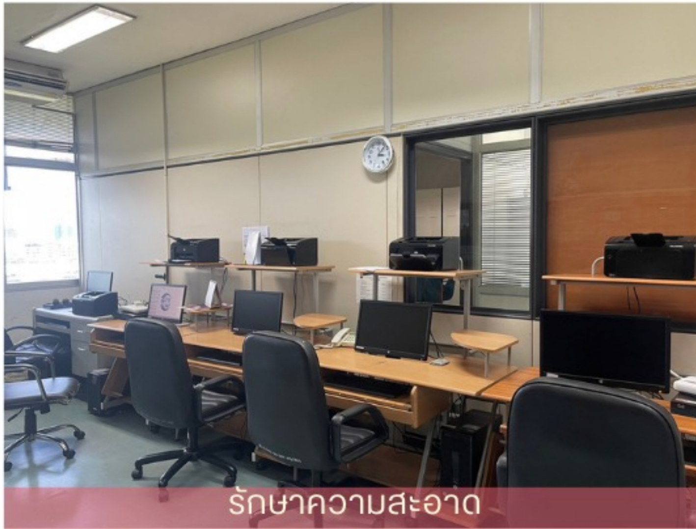
รักษาความสะอาด