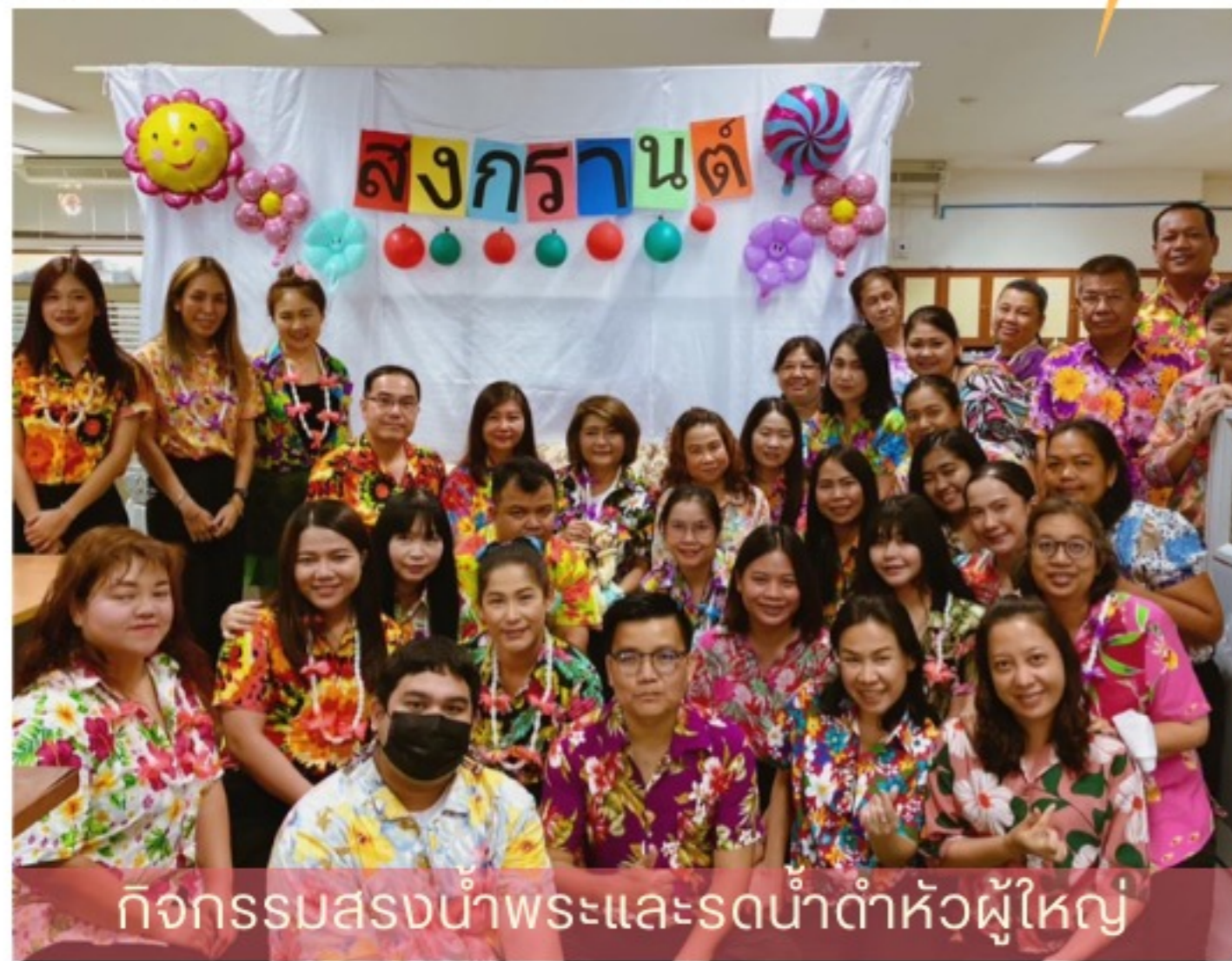
กิจกรรมสงน้ำพระและรดน้ำดำหัวผู้ใหญ่